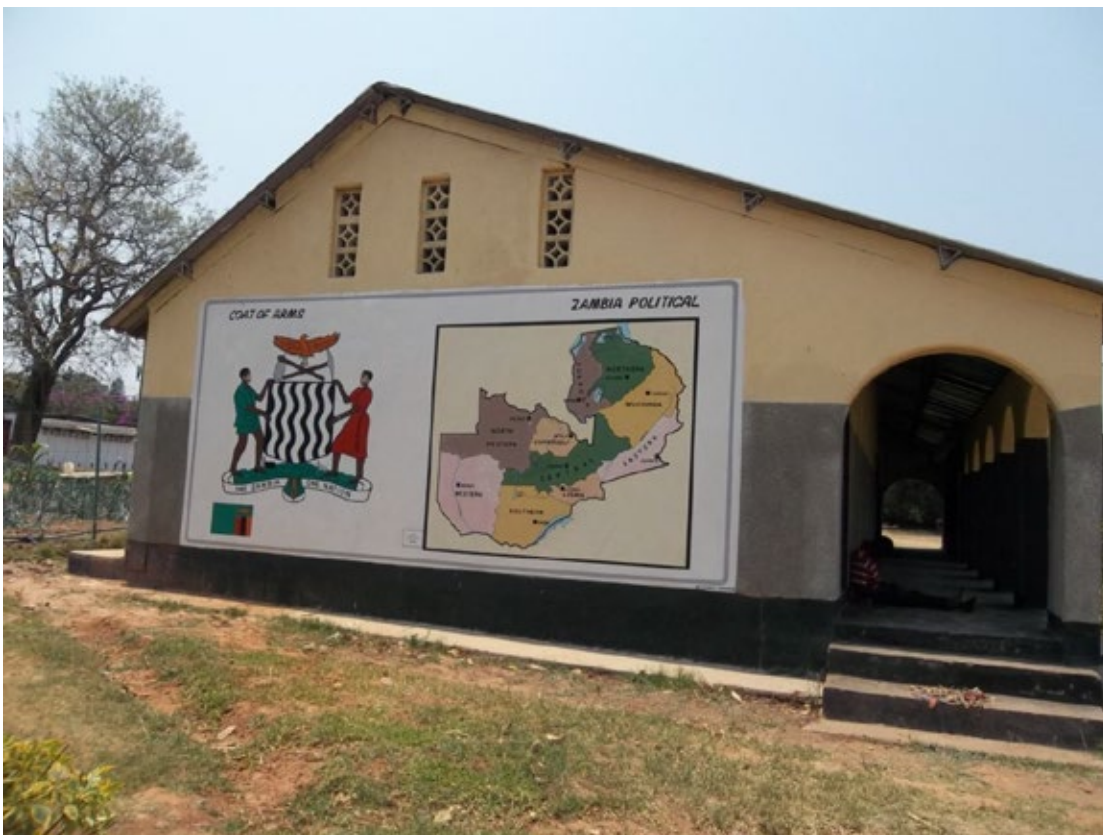
Am Ende diess Gebäudes soll ein neues Klassenzimmer angebaut werden.