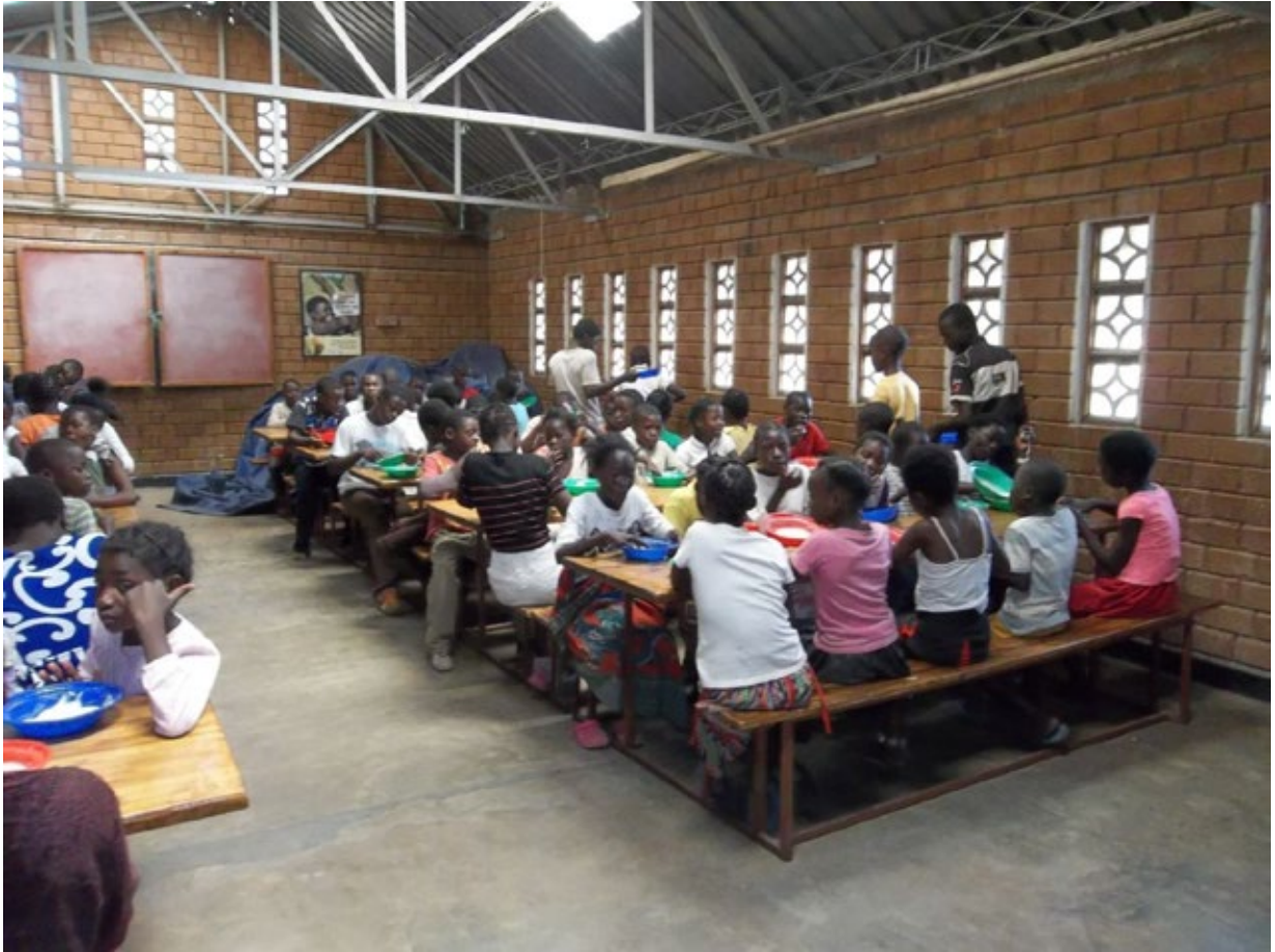
In der Pause gibt es etwas für den hungrigen Magen!