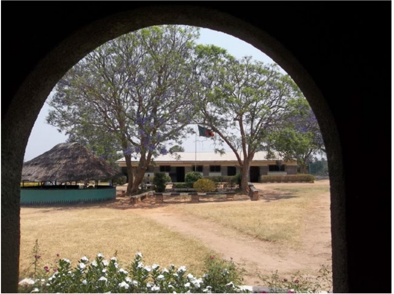
Barefoot Chisankano Community School