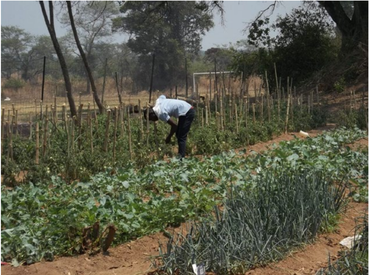
Der Garten sorgt für Gemüse für unsere Kinder.